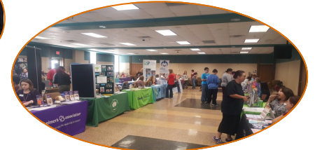
Recursos y Expositores