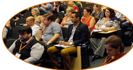
Sesiones de trabajo