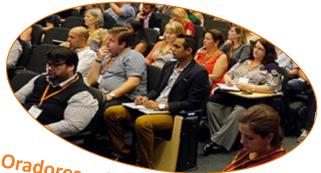
Oradores principales de apertura y desayuno de cortesía

El Consejo IDD se enorgullece de asociarse con los siguientes ISD para ofrecerle "HACER CONEXIONES" NORTH TARRANT